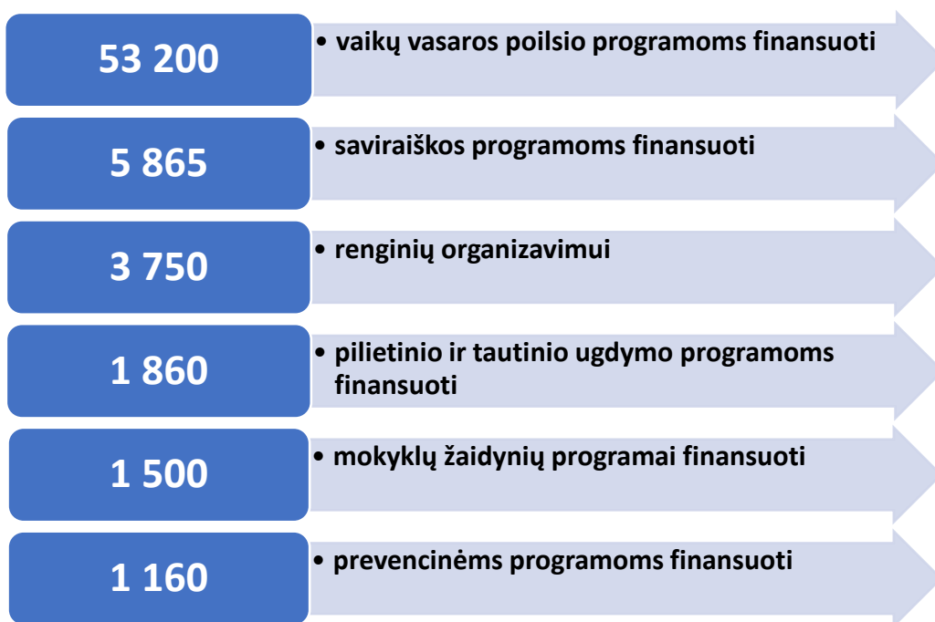
2 pav. Priemonei 1.1.1.2 įgyvendinti 2020 m. skirti asignavimai, tūkst. eurų

Siekiant užtikrinti mokinių saviraišką, socializaciją, pilietinį ir tautinį ugdymą, sportinį aktyvumą, vasaros užimtumą, Priemonei Nr. 1.1.1.2 įgyvendinti Savivaldybės administracijos direktoriaus įsakymais per 2020 metus skirta 67 335 eurų asignavimų, iš jų: