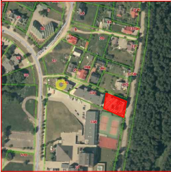
Žemės sklypo išdėstymo schema